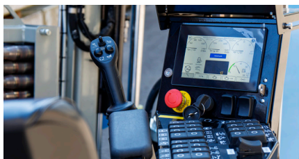
Allwetter 7" Touchscreen