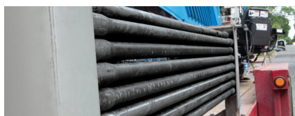
Gestängemagazin Kapazität 61 Meter, optional 76 Meter