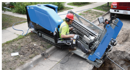
Einfache Einstellung des Neigungswinkels von 11-17°